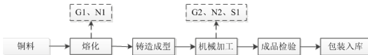
图 5-1 产品生产工艺流程图及产污环节图