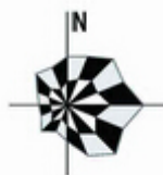
图 2-1 姜堰区风向玫瑰图

姜堰区属于北亚热带季风气候。季风环流气候影响显著，四季分明，冬夏较长，春秋较短。常年平均气温 14.5℃；年平均积温 5365.6℃；年平均降水量 991.7 毫米，年平均雨日 117 天；年平均日照时数 22059 小时；无霜期 215 天。作物生长季较长，日平均气温高于 10℃的作物生长期平均为 223 天，高于 15℃喜温作物生长期 172 天。全年气候温暖，光照充足，雨水充沛，农业气候条件优越。