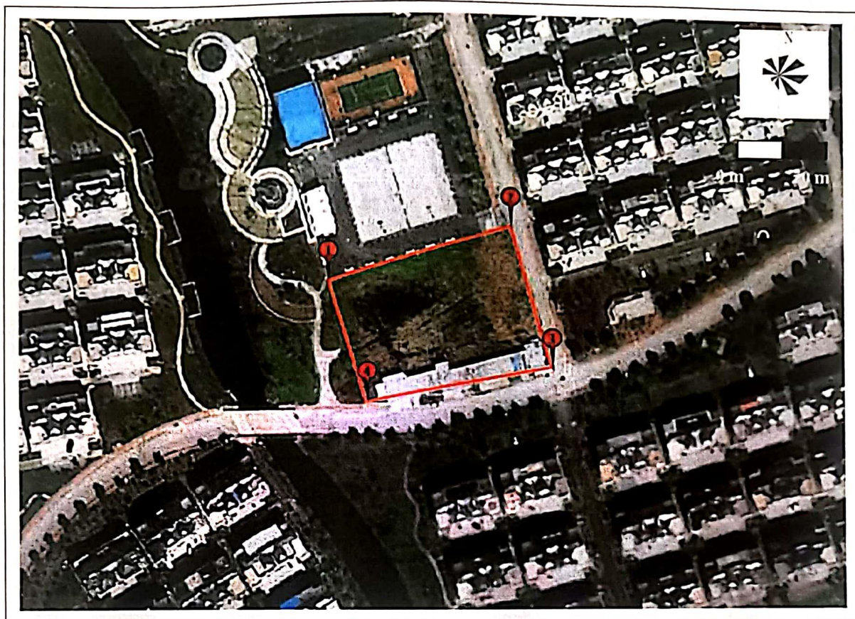
图 1.2-2 调查地块边界及拐点