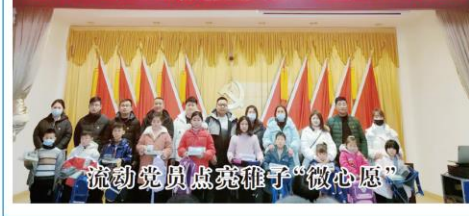
瑞沟乡官塘社区流动党员结对留守儿童帮扶仪式