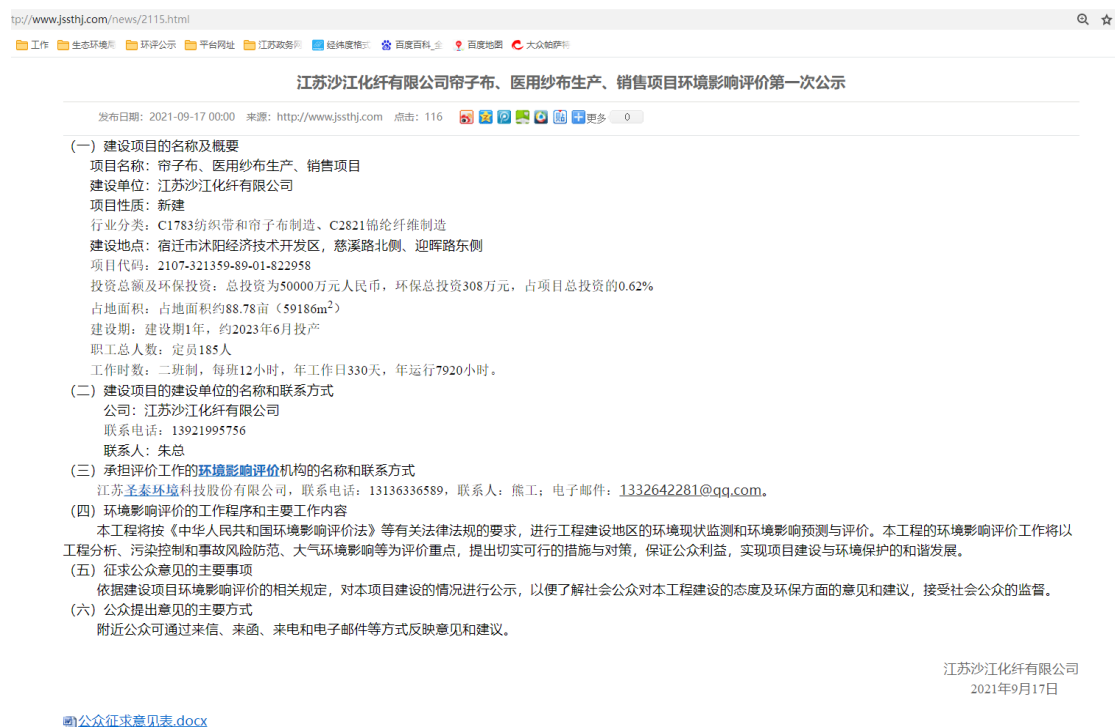
图 1 首次公示截图