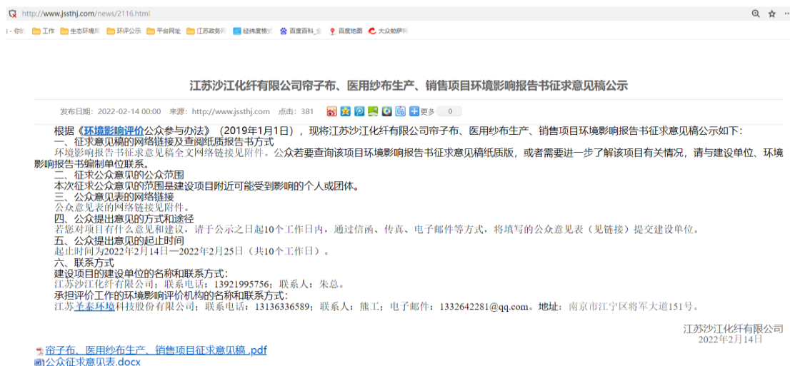
图 2 征求意见稿网络公示截图